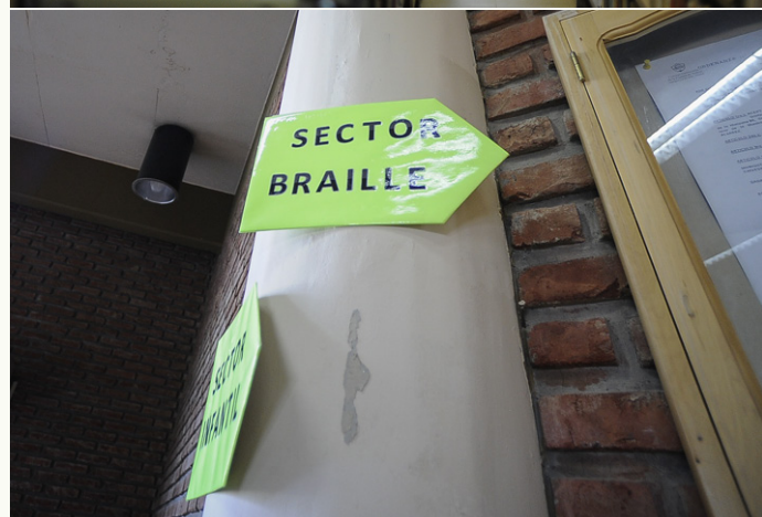
Pasillos de la biblioteca popular.